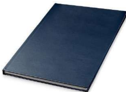
Рисунок 3 – Образец книжного переплета

Дипломная работа должна быть брошюрована надлежащим образом в книжном переплете (рисунок 3).