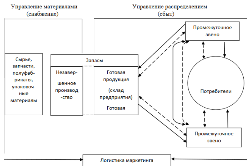
Рисунок 1 – Принципы логистической системы Рисунок 1 – Пример оформления рисунка

Иллюстрации должны иметь наименование и, если необходимо, пояснительные данные (подрисовочный текст). Слово «Рисунок», его номер и через тире наименование помещают после пояснительных данных и располагают в центре под рисунком без точки в конце (рис.1).