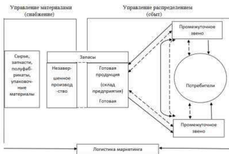
Рисунок 1 – Принципы логистической системы Рисунок 1 – Пример оформления рисунка

Иллюстрации должны иметь наименование и, если необходимо, пояснительные данные (подрисуночный текст). Слово «Рисунок», его номер и через тире наименование помещают после пояснительных данных и располагают в центре под рисунком без точки в конце (рис. 1).