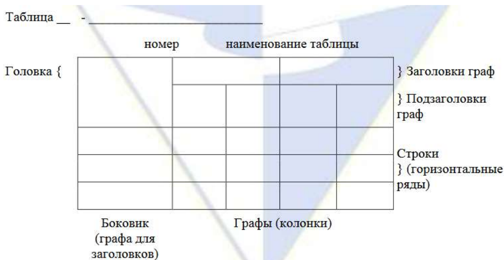
Рисунок 2 – Макет таблицы

После таблицы должно быть оставлено не менее одной свободной строки.