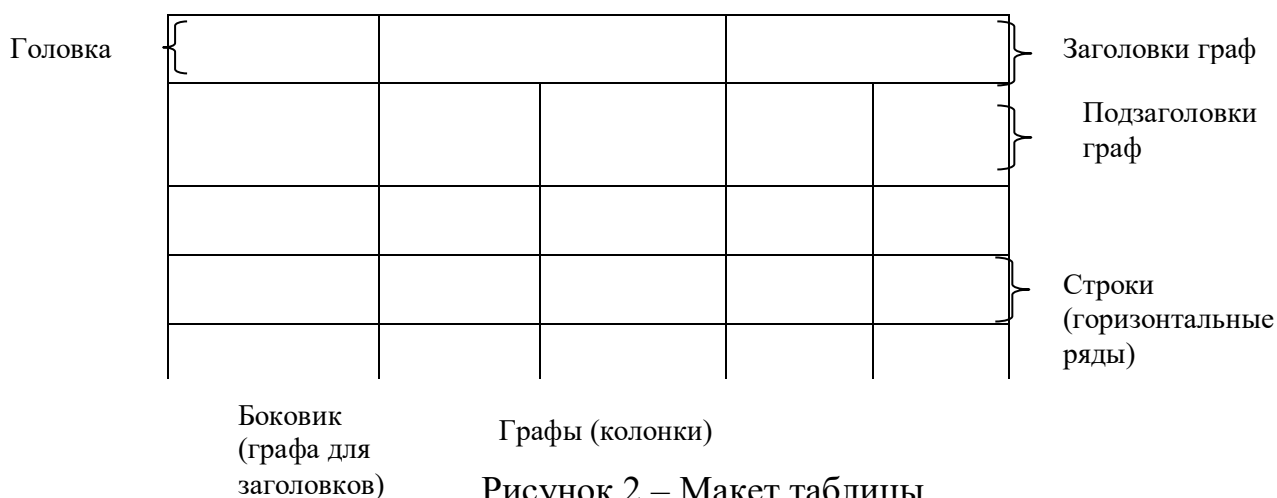
Рисунок 2 – Макет таблицы

Таблицы, за исключением таблиц приложений, следует нумеровать арабскими цифрами сквозной нумерацией.