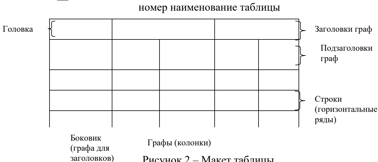
Таблица __ - _____

Таблицы, за исключением таблиц приложений, следует нумеровать арабскими цифрами сквозной нумерацией.