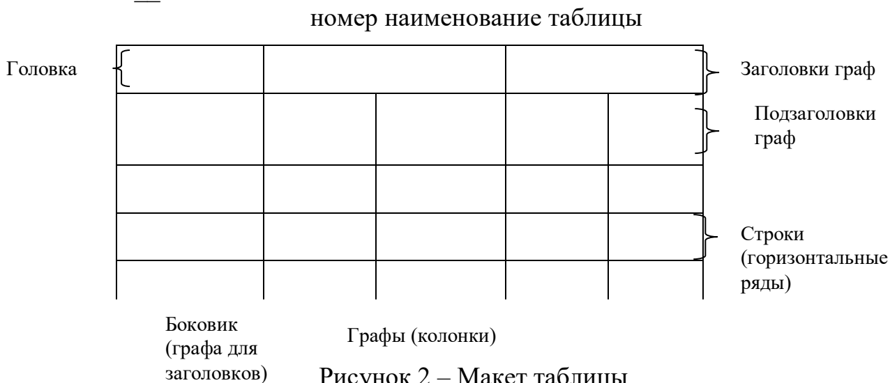
Таблица __ - _____

Таблицы, за исключением таблиц приложений, следует нумеровать арабскими цифрами сквозной нумерацией.