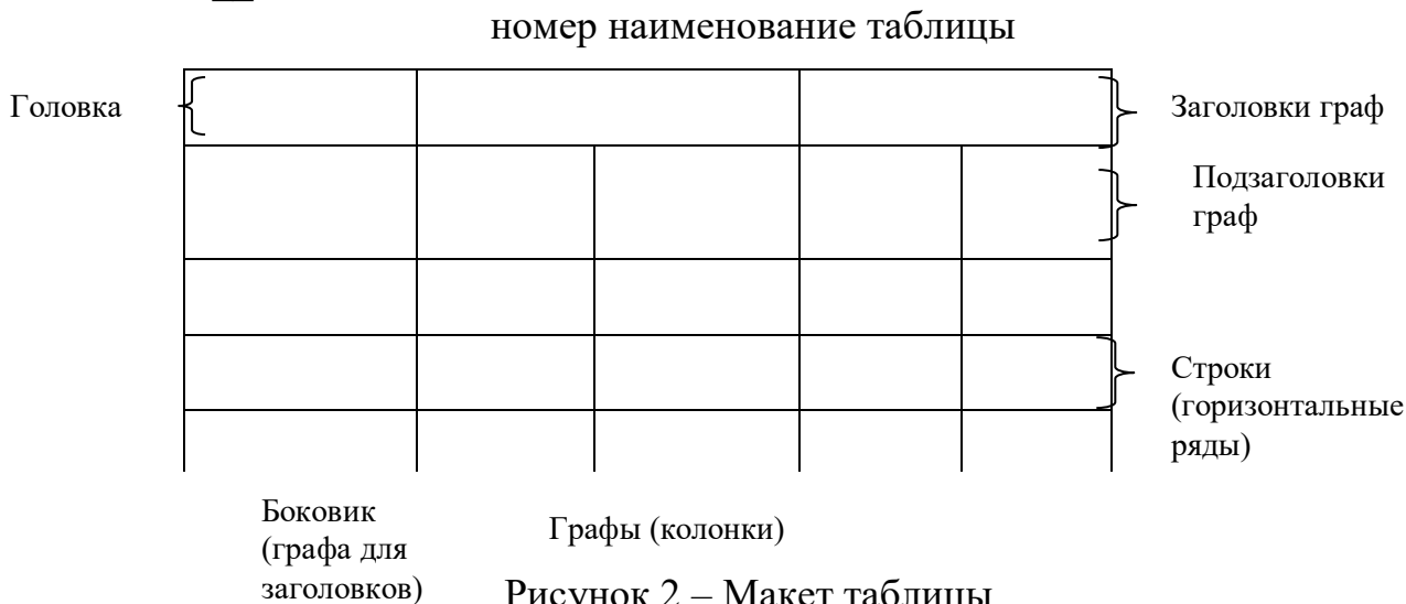
Рисунок 2 – Макет таблицы

Таблицы, за исключением таблиц приложений, следует нумеровать арабскими цифрами сквозной нумерацией.