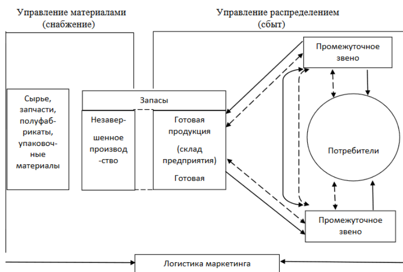
Рисунок 1 – Принципы логистической системы Рисунок 1 – Пример оформления рисунка

Иллюстрации должны иметь наименование и, если необходимо, пояснительные данные (подрисуночный текст). Слово «Рисунок», его номер и через тире наименование помещают после пояснительных данных и располагают в центре под рисунком без точки в конце (рис.1).